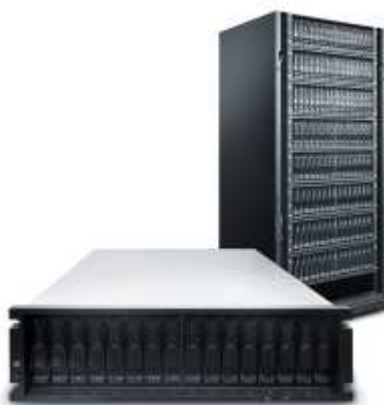
Рис. 16. Система хранения данных