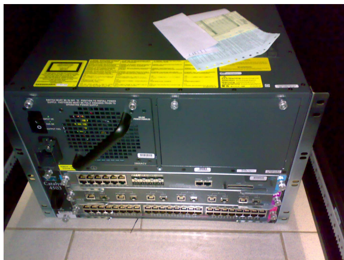
Рис 15. Узел связи и магистральное оборудование ИИВС ИрНОК

Развитие на базе ИИВС ИрНОК систем хранения данных: