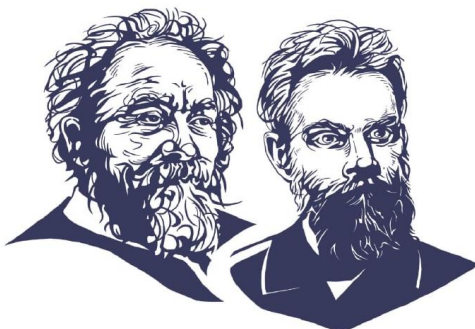
А. А. Ляпунов