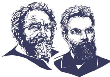
А. А. Ляпунов