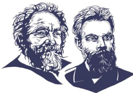
А. А. Ляпунов